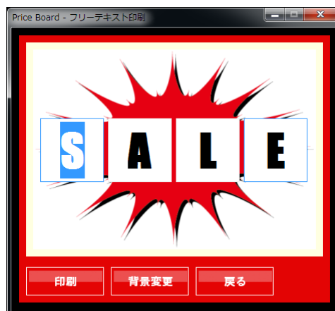
「 プライスボード テンプレート 」のフリーテキスト印刷画面

また、『任意の文字を印刷します』と書かれたデザインを選択して「印刷」ボタンをクリックすると、次のような画面が表示されます。