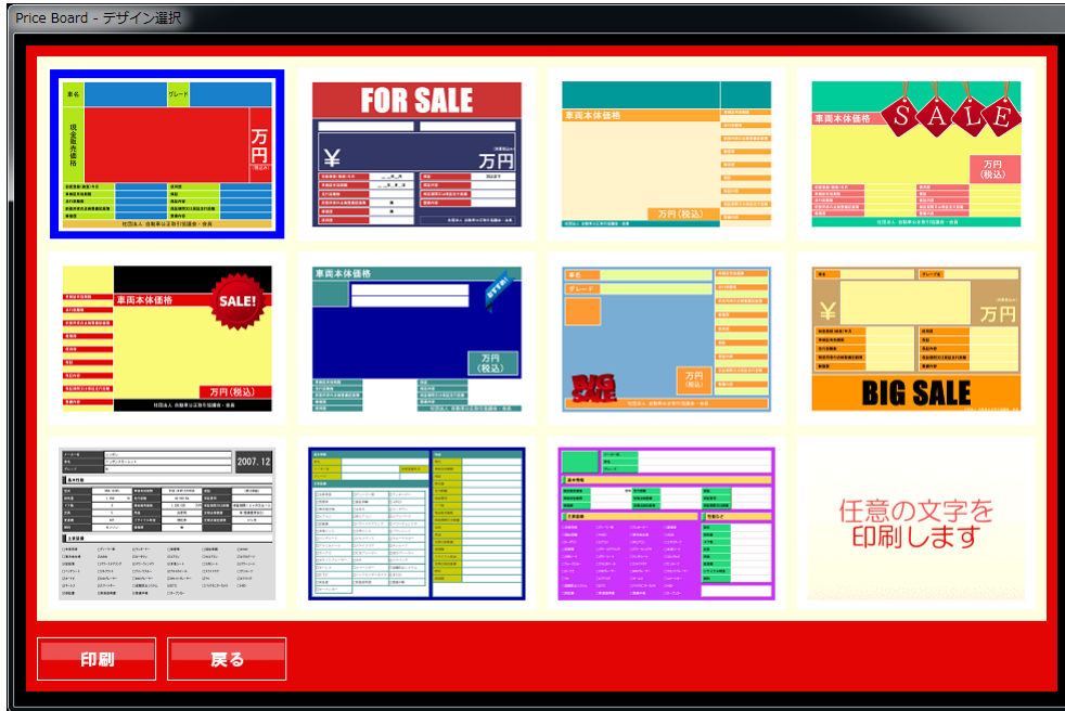
「 プライスボード テンプレート 」のデザイン選択画面

印刷したいプライスボードのデザインを選択し、画面左下の「印刷」ボタンをクリックします。メイン画面の「頁設定」ボタンより指定したプリンタに、選択したデザインのプライスボードが印刷されます。