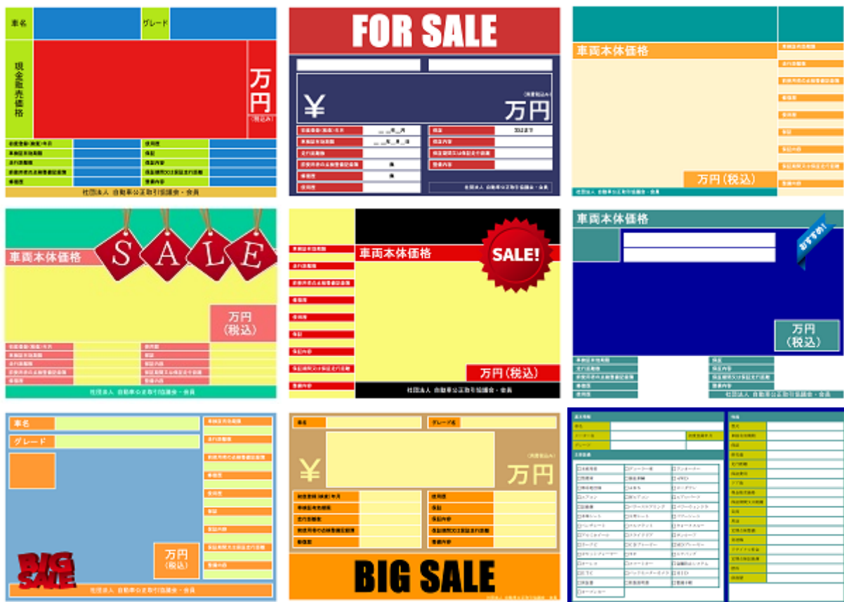
「プライスボード テンプレート」で印刷できるプライスボードデザインの例

あらかじめ用意された複数のテンプレートのなかから、好みのデザインを選択して印刷することができます。一度入力した中古車データは、ファイルに出力することが可能です。ファイルに出力した中古車データをアプリケーションから読み込むことで、再入力する手間を省くための機能も保持しています。